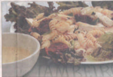
SALADA COM fanelli e tomate seco é a novidade do Jambreiro

Já o Jambreiro aposta nas inovações. Só este mês, três novas saladas entraram no cardápio. Com fanelli, tomate seco, parmesão em lascas, mozzarella de búfala e azeitona preta, a salada Jambreiro (R$ 13,50) é servida ao molho pesto. Já a italiana (R$ 15,50) vem com fatias de peru defumado, provolone, abacaxi, tomate-cereja, rúcula, alface americana e molho de mostarda e mel. Para