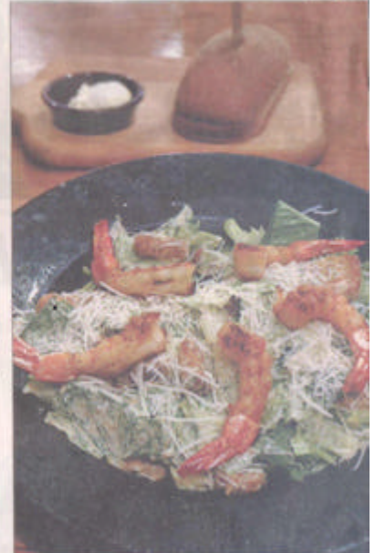
A BRISBANE caesar salad, do Outback, vem com camarões grelhados